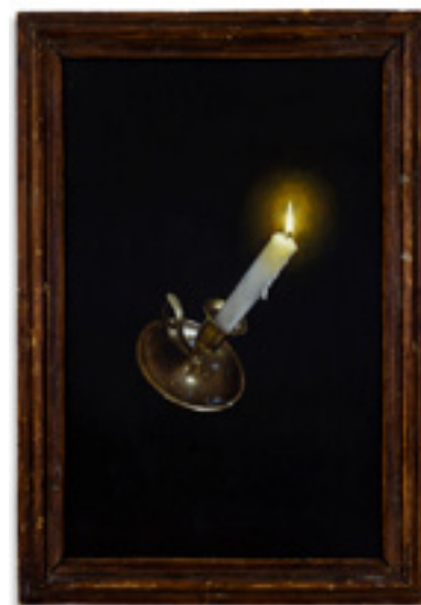
JEAN LABOURDETTE aka Turf One Spiritism - acrylique sur bois - 2016