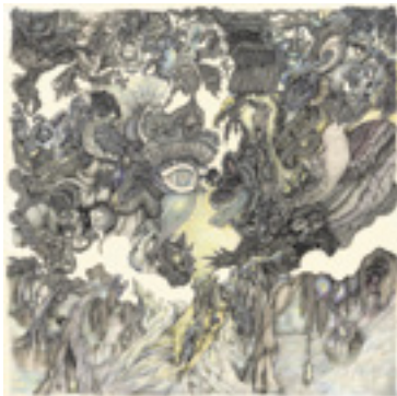
CHRISTELLE LENCI Apparitions 2 - crayon de couleurs sur papier - 2020

Les beaux-arts, sans être reniés, y sont cités, parfois revendiqués ; les arts folk, pop et de rue y sont valorisés ; les arts singuliers et outsiders – « œuvres instinctives, dans tous les cas déconditionnées de la chose apprise » comme les évoquait Alain Bourbonnais à Jean Dubuffet – s'y voient associés. Ce groupement hétérogène ne défend pas d'école ou de courant théorisé, il transcrit un état d'esprit, un rythme interne obsessionnel de création, un positionnement au monde et une porosité des frontières quant à l'utilisation des médiums de production. La revue HEY! accompagne depuis 2010 cette dynamique avec ses trois concepts fondateurs : « la mixité par le rassemblement, la résistance par l'imaginaire, l'action du moderne ».