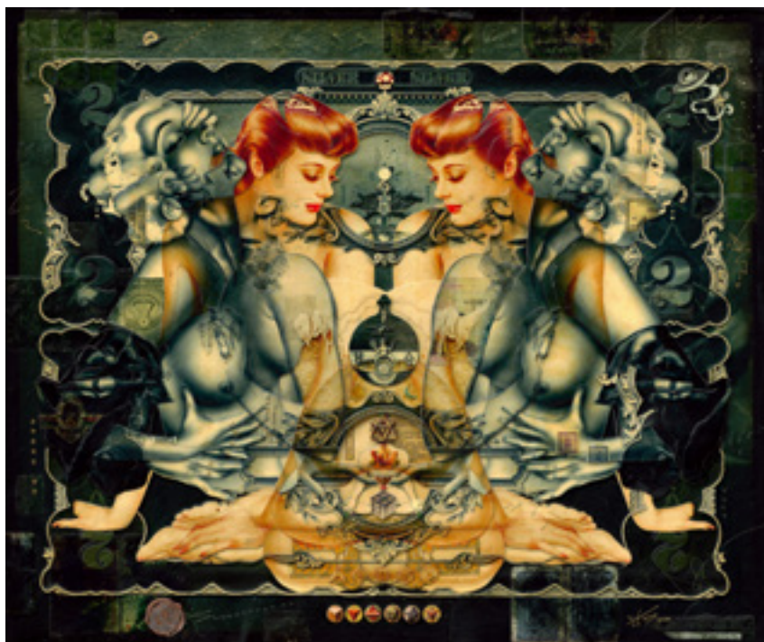
HANDIEDAN. Goddess In Us - papier découpé, collage, mix media - 2020

Figure de proue du surréalisme pop européen, les œuvres de Handiedan consistent en un phrasé complexe de découpage et de collage de montages digitaux qu'elle achève par un minutieux travail de sculpture en couche. Ce processus questionnant l'accumulation, il s'agit aussi de conceptualiser la multiplicité des identités du féminin contemporain, à partir du corps classique de la pin-up et de sa perception stéréotypée persistante. Avec une formation en design photographique et un savoir autodidacte en dessin, l'artiste a débuté son travail en 2007. Son œuvre urbaine multi-média et street art est exposée à travers le monde en musée et galerie, et se déploie en plein air, format monumental. Les œuvres de Handiedan présentées à la Halle Saint Pierre sont également inédites en France, Goddness In Us et Rings Of Saturne Ligne ont été créées spécialement pour HEY!.