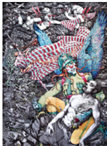
ERDEVEN DJESS Dormeur du Val - stylo bille sur papier - 2019.