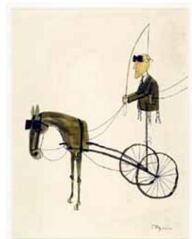
TOMI UNGERER - Sans titre , 1964 Encre de Chine sur papier-calque - 27 x 35,5 cm Coll. Musée Tomi Ungerer - Centre international de l'illustration, Strasbourg