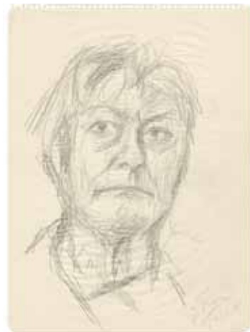
PIERRE TAL COAT - Autoportrait 1975-1976 - Mine de plomb sur papier - 31 x 23 cm Coll. particulière