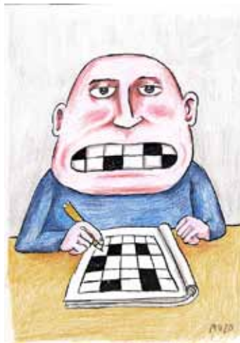
MUZO - Sans titre années 2000 Encre et crayon de couleur Collection de l'artiste © Muzo