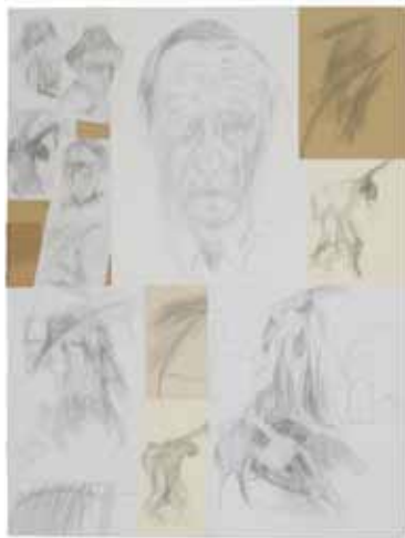
PIERRE TAL COAT - Autoportrait 1975-1976 - Mine de plomb sur papier 31 x 23 cm - Collection particulière