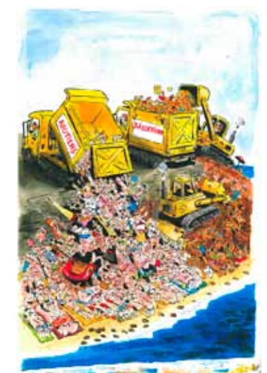
VUILLEMIN Dessin paru dans L'Echo des savanes, années 1990-2000 - Technique mixte