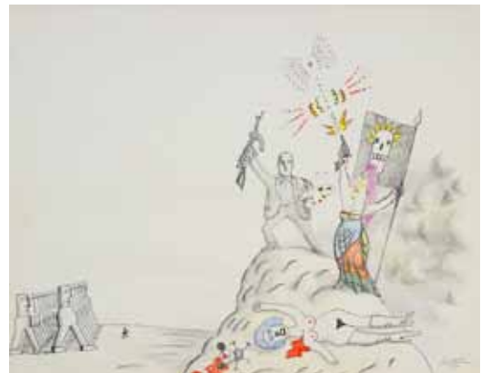
SAUL STEINBERG - Révolution culturelle - Art news 1970 - Crayon - 58 x 74 cm Coll. Isabelle Maeght, Paris © ADAGP, Paris 2015 Photo Galerie Maeght, Paris