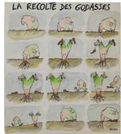
REISER - Dessin paru dans Hara-Kiri, années 1960-1970 - Encre et aquarelle 50 x 35 cm