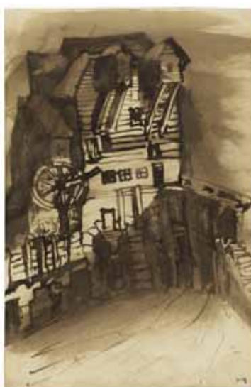
Victor HUGO - La lanterne magique sans date, Plume et lavis d'encre brune 26,3 x 17,3 cm Maison de Victor Hugo