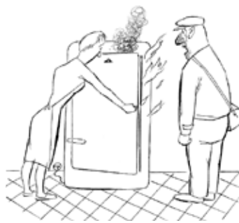
CHAVAL - Le réfrigérateur en flammes années 1950-1960 41 x 37,5 cm