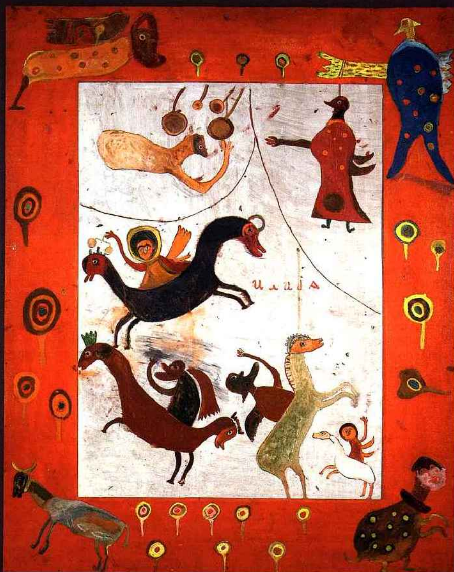
Ilija Basicovic Bosilj, Les Cavaliers de l'Apocalypse