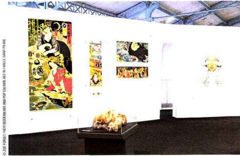
© ZOE FORGET / HEIN MODERN ART AND POP CULTURE ACT III / HALLE SAINT PIERRE