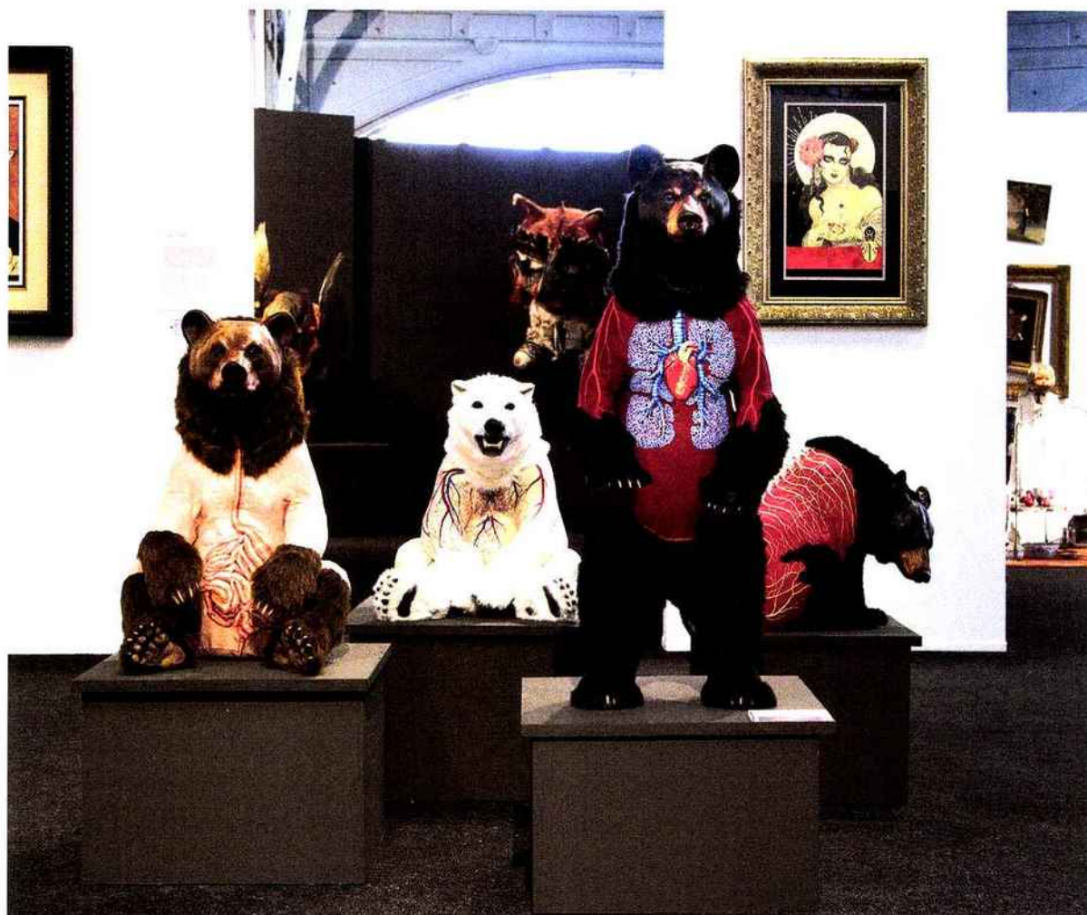
© ZOE FORBET / HEY MODERN AND POP CULTURE ACT BY HALL SAINT PIERRE