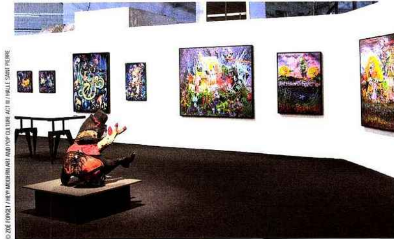
© ZOE FORGET / HEIN MODERN ART AND POP CULTURE ACT III / HALLE SAINT PIERRE