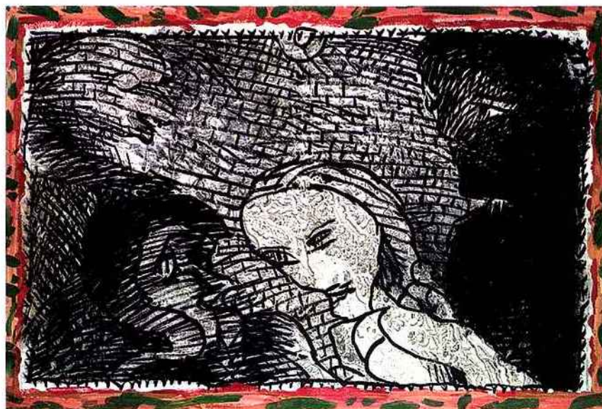
Pierre Alechinsky, La diagonale de Montagu , 1990, encre avec une peinture acrylique sur carte de géographie gravée au XVII e siècle marouflée sur toile, 67 x 100 cm, © Pierre Alechinsky, ADAGP Paris 2015 / Collection de l'artiste

« Le dessin n'a pas la place qu'il devrait avoir. Il est le parent pauvre des beaux-arts. » En 2002, cet âpre constat de Frédéric Pajak conduisait l'écrivain et dessinateur suisse à créer une maison d'éditions – Les cahiers dessinés – puis une revue annuelle – le Cahier dessiné , dont se célèbre cette année le dixième anniversaire.