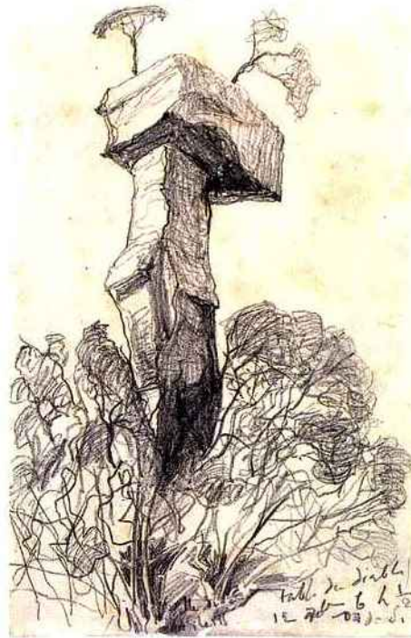
Victor Hugo, La Taille du diable, 1865, mine de plomb, 26 x 17 cm