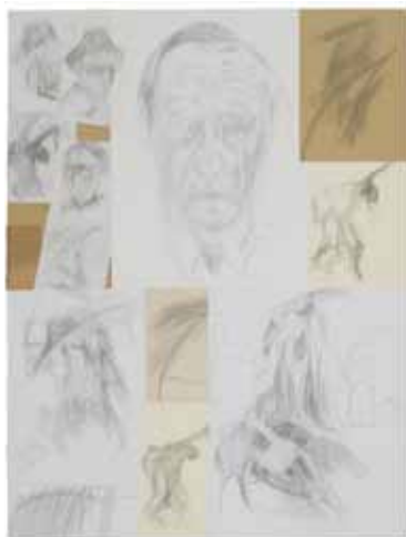
MARCEL KATUCHEVSKI Ne m'attendez plus , 2014 Mine de plomb et collage - 80 x 60 cm Collection de l'artiste