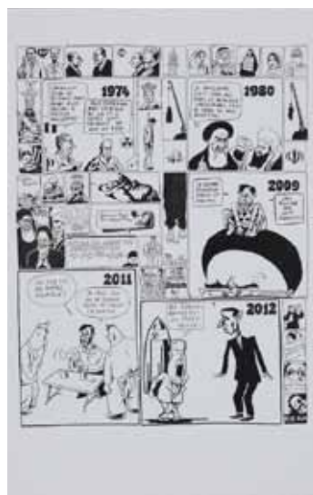
WILLEM Dessin paru dans Charlie Hebdo et Libération, années 2000 - Encre et stylo feutre 65 x 50 cm © Willem / Coll. de l'artiste / Photo Olivier Brunet