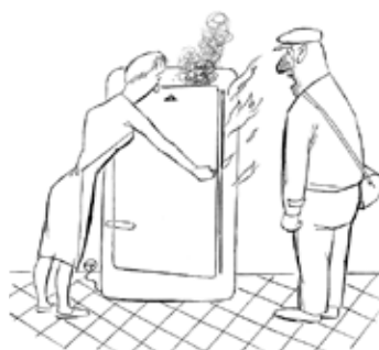
CHAVAL - Le réfrigérateur en flammes années 1950-1960 41 x 37,5 cm