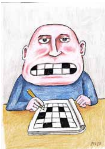
MUZO - Sans titre années 2000 Encre et crayon de couleur Collection de l'artiste © Muzo