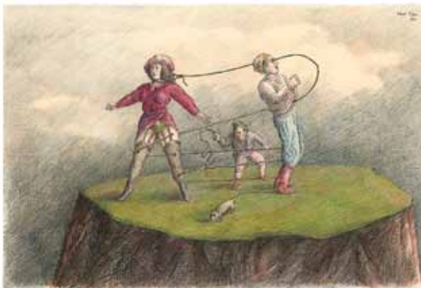
ROLAND TOPOR - Happy-End , 1977 Stylo, encre et crayon de couleur - 32,2 x 24 cm © Roland Topor, ADAGP Paris 2015 / Œuvre publiée dans Therapien , 1982, Diogenes Verlag, AG Zurich / Coll. particulière