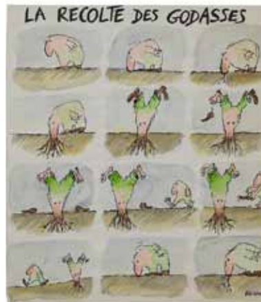
REISER - Dessin paru dans Hara-Kiri, années 1960-1970 - Encre et aquarelle 50 x 35 cm