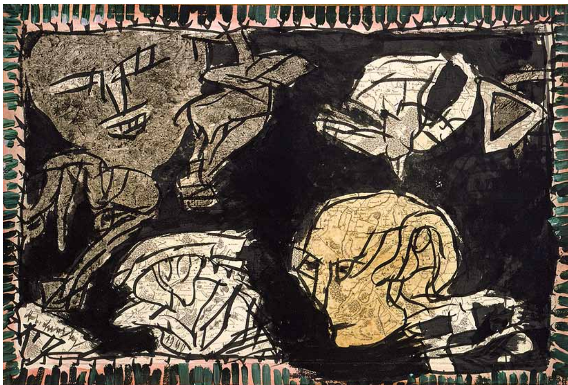
PIERRE ALECHINSKY - Le pigeon d'Hazebroek Encre avec une bordure acrylique sur carte de géographie gravée au XVII e siècle marouflée sur toile 67 x 100 cm - Coll. de l'artiste © ADAGP Paris 2015