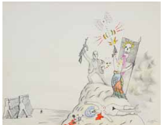
SAUL STEINBERG - Révolution culturelle - Art news 1970 - Crayon - 58 x 74 cm Coll. Isabelle Maeght, Paris © ADAGP, Paris 2015 Photo Galerie Maeght, Paris