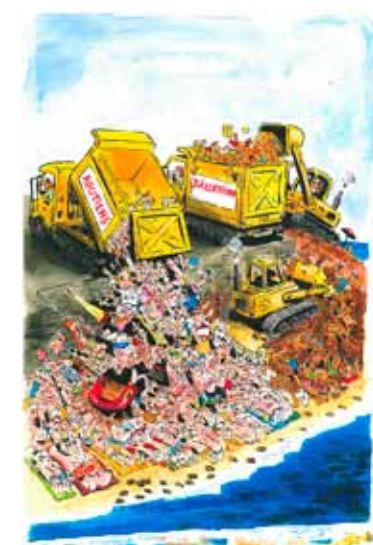
WILLEM Dessin paru dans L'Echo des savanes, années 1990-2000 - Technique mixte