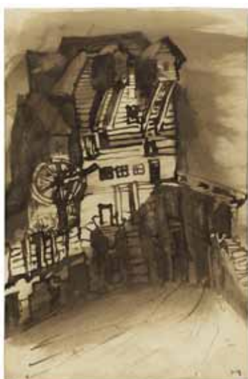
Victor HUGO - La lanterne magique sans date, Plume et lavis d'encre brune 26,3 x 17,3 cm Maison de Victor Hugo