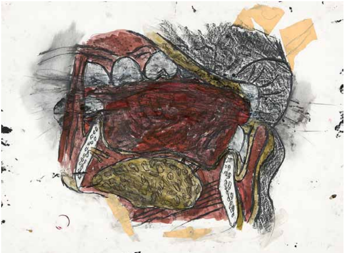
KIKI SMITH - Teeth drawing 4 , 1983 - Encre, graphite et acrylique sur papier - 56,8 x 76,5 cm - Galerie Lelong