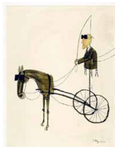
TOMI UNGERER - Sans titre , 1964 Encre de Chine sur papier-calque - 27 x 35,5 cm Coll. Musée Tomi Ungerer - Centre international de l'illustration, Strasbourg