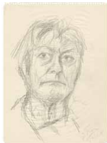
PIERRE TAL COAT - Autoportrait 1975-1976 - Mine de plomb sur papier - 31 x 23 cm Coll. particulière