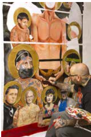
MIKAËL DE POISSY, En création, Sans titre 2018/2019. Acrylique sur toile. 214 cm x 180 cm