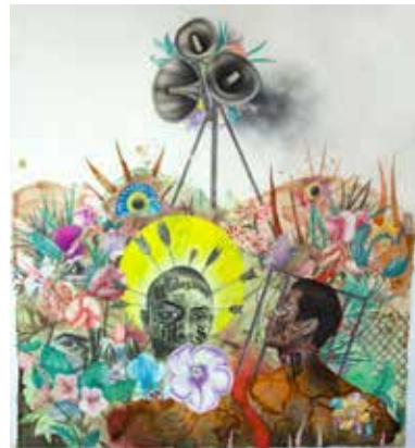
OSVALDO RAMIREZ-CASTILLO, Outsiders II 2018. Dessin et technique mixte sur Mylar. 57,15 x 61 cm.