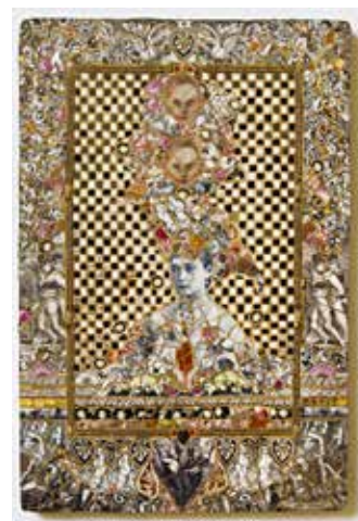
SÉVERINE GAMBIER, Lamento concertant 2018. Assiettes de porcelaine et faïence, pâte de verre italienne, support bois, résine, colle et patine. 38 x 27 cm.