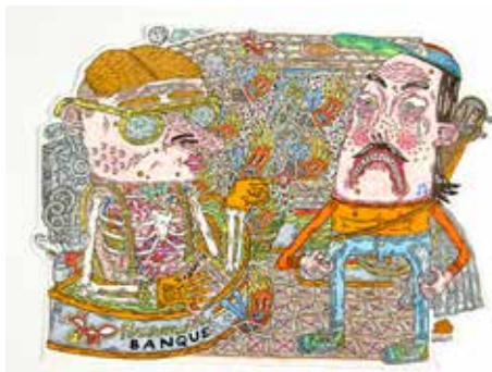
MATHIEU LEWIN, La Banque . 2017. Stylo encre de chine, feutre et stylo gel. 20 x 28 cm.