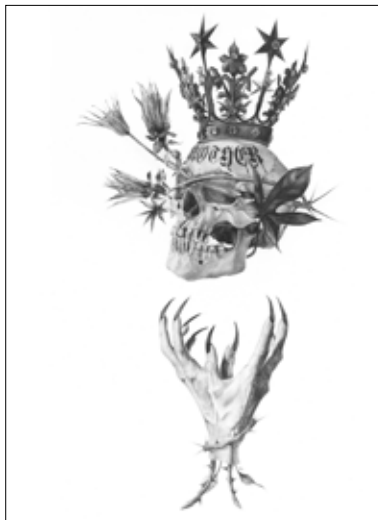
LIZZ LOPEZ, Mother . 2017. Mine de plomb sur papier Arches. 76,2 x 50,8 cm.