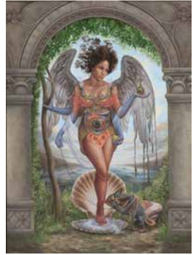
HEIDI TAILLEFER, Pelican and the Vampire 2010. Huile sur toile. 137,2 x 111,8 cm