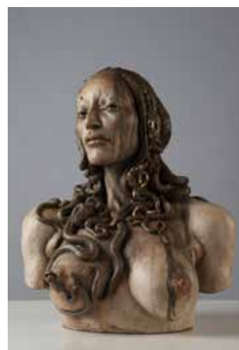
CHEN M, La Gorgone . 2015. Terre cuite, feuille d'or. 60 x 50 x 40 cm.