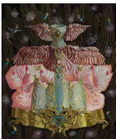
MARYROSE CROOK, Crepuscule: Holy Ghost 2018. Huile sur toile. 91,44x 76,2 cm.