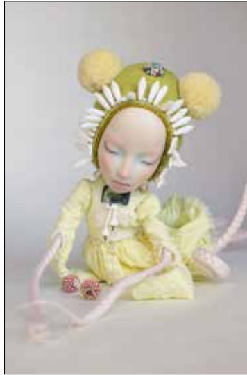
SHELTER SHIRSTONE, Matricaria Chamomilla OctoRat «KAMILLA» . 2017. Porcelaine, encre de Chine, laine, coton, perles en verre. 24(h) x 8(l) x 6(p) cm.