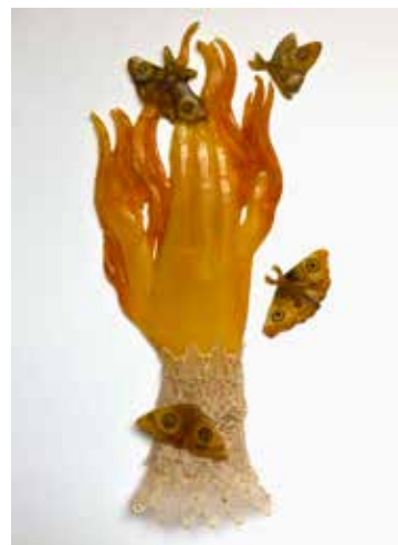
HEATHER O'SHAUGHNESSY, A Lovely Suffering on a Soft Spring Night . 2018. Cire d'abeille, peinture à l'huile, feuille d'or. 21,6 x 15,2 cm.