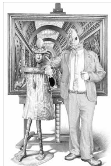
MAD MEG, Patriarche N°7 - Le Marchand . 2018. Encre de chine sur papier. 220 x 140 cm.