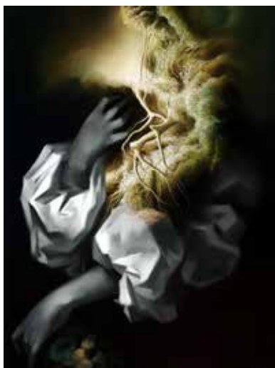
VASILIS AVRAMIDIS, Mild Weather . 2018. Huile sur toile. 60 x 45 cm