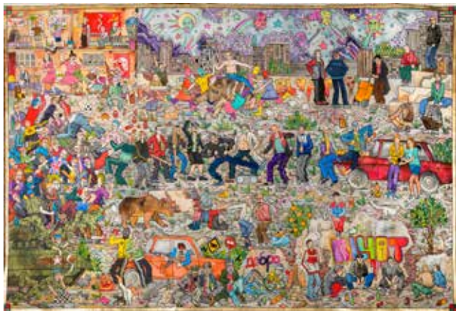
AGATHE PITIÉ, Les enfants des GOP . 2018. Encre, feuille d'or, acrylique et aquarelle sur papier. 100 x 140 cm.