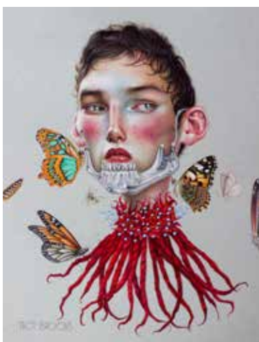
TROY BROOKS, Veiled Apollo 2018. Crayon de couleur sur papier. 35,56 x 27,94 cm. Courtesy de l'artiste