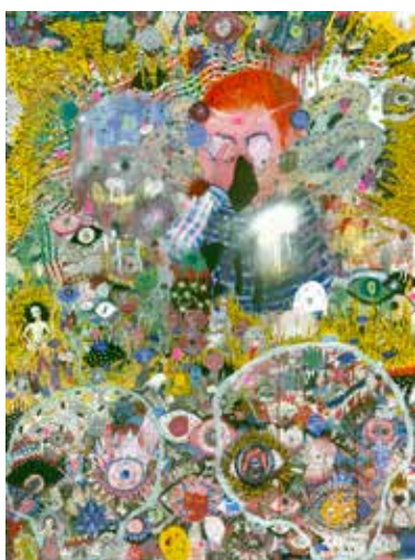
NILS BERTHO, Vorace Wallace . 2018. Rotring, encre de chine, acrylique, fusain et encres sur toile. 130 x 100 cm.