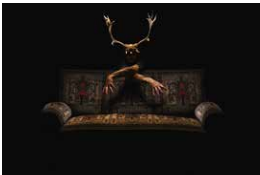
YANNICK UNFRICHT, Entité 1 . 2018. Photographie numérique, impression sur Dibond. 30 x 45 cm.