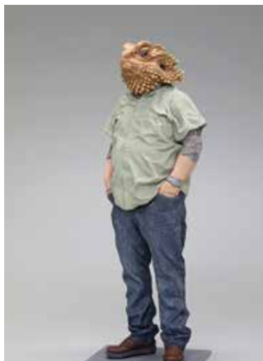
ALESSANDRO GALLO, I Don't Want to Grow Up . 2016. Céramique, technique mixte. 45,7 x 15,2 x 15,2 cm.