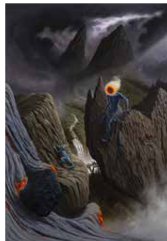
FULVIO DI PIAZZA, Homecoming . 2017. Huile sur toile. 190 x 150 cm.