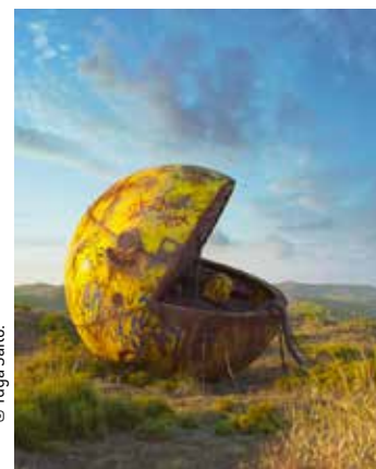
FILIP HODAS, Pac-man . 2017. Création numérique 3D, impression sur Dibond. 65 x 50 cm.