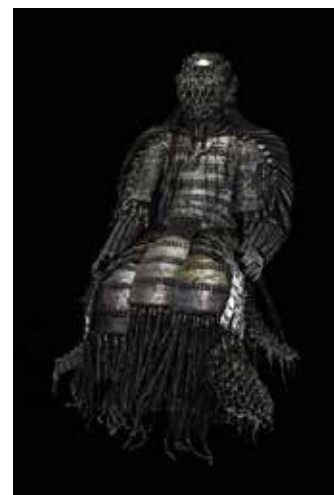
BRIGITTE LAJOINIE, Sans Titre n°5 . 2017. Assemblage matériaux mixtes. 160 x 81 x 121 cm.