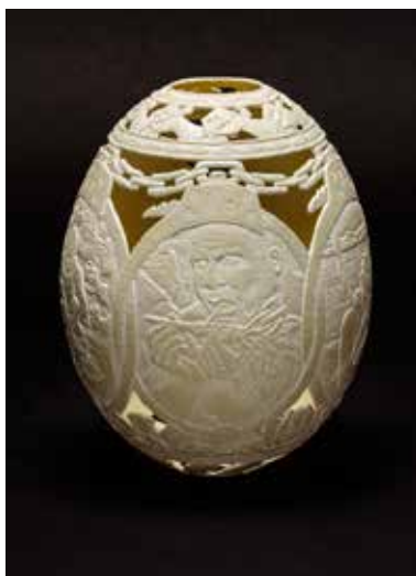
GIL BATLE, Time Killer . 2016. Bas relief sculpté sur œuf d'autruche 15,25 x 12 cm.