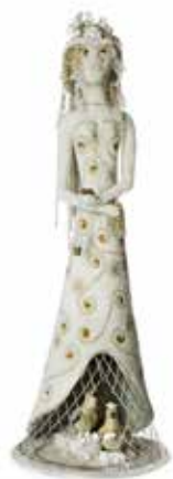
NANCY JOSEPHSON, Pwen Blanc . 2016. Technique mixte (perles anciennes et contemporaines, bois sculpté, fleurs funéraires anciennes françaises ornées de perles, réceptacle en forme d'oiseau contenant huiles et herbes). 79 x 40 x 30 cm.