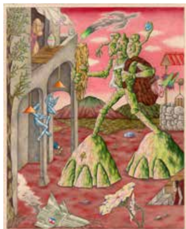
DAVOR GROMILOVIC, Stone Baker and the Crash of Yugo Rocket . 2018. Mine de plomb et crayon de couleur sur papier. 31 x 25 cm.