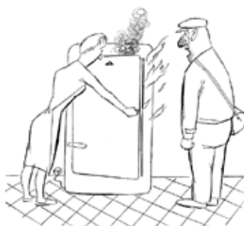
CHAVAL - Le réfrigérateur en flammes années 1950-1960 41 x 37,5 cm