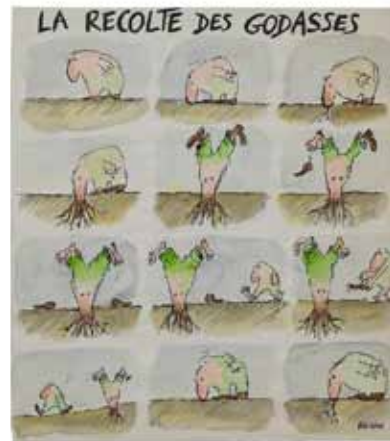
REISER - Dessin paru dans Hara-Kiri, années 1960-1970 - Encre et aquarelle 50 x 35 cm