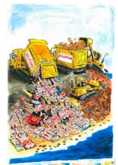
VUILLEMIN Dessin paru dans L'Echo des savanes, années 1990-2000 - Technique mixte