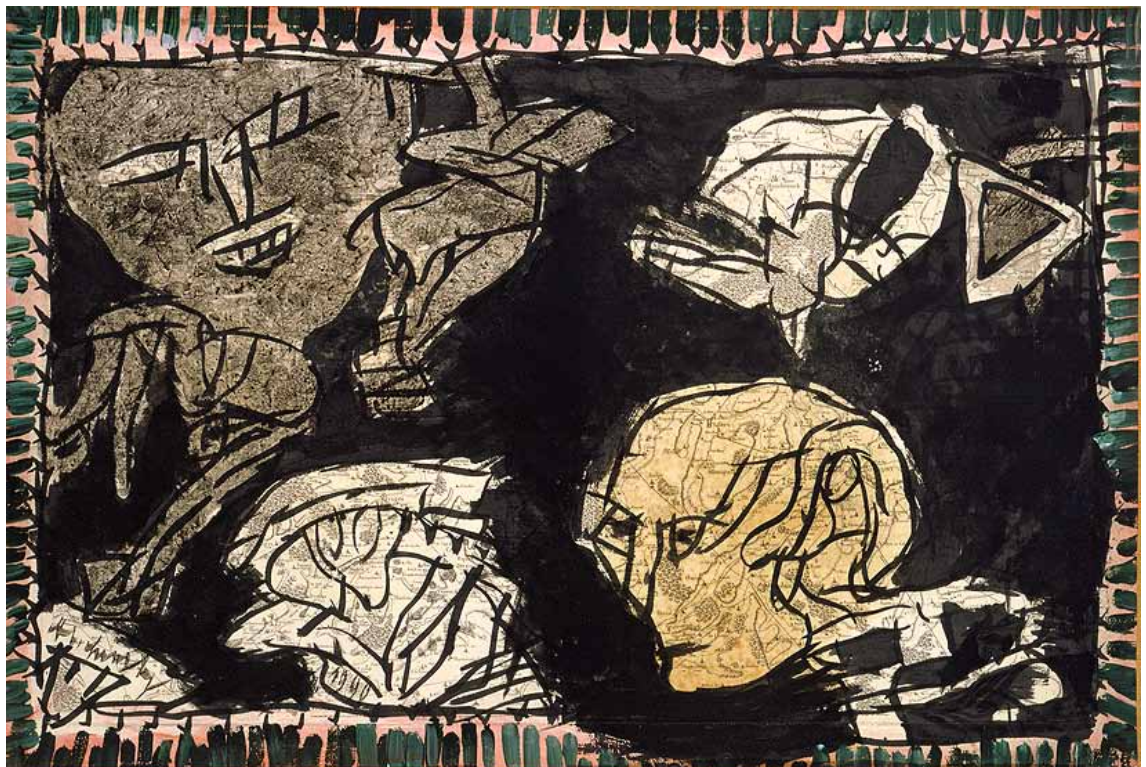
PIERRE ALECHINSKY - Le pigeon d'Hazebroek Encre avec une bordure acrylique sur carte de géographie gravée au XVII e siècle marouflée sur toile 67 x 100 cm - Coll. de l'artiste © ADAGP Paris 2015