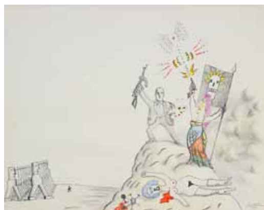
SAUL STEINBERG - Révolution culturelle – Art news 1970 - Crayon - 58 x 74 cm Coll. Isabelle Maeght, Paris © ADAGP, Paris 2015