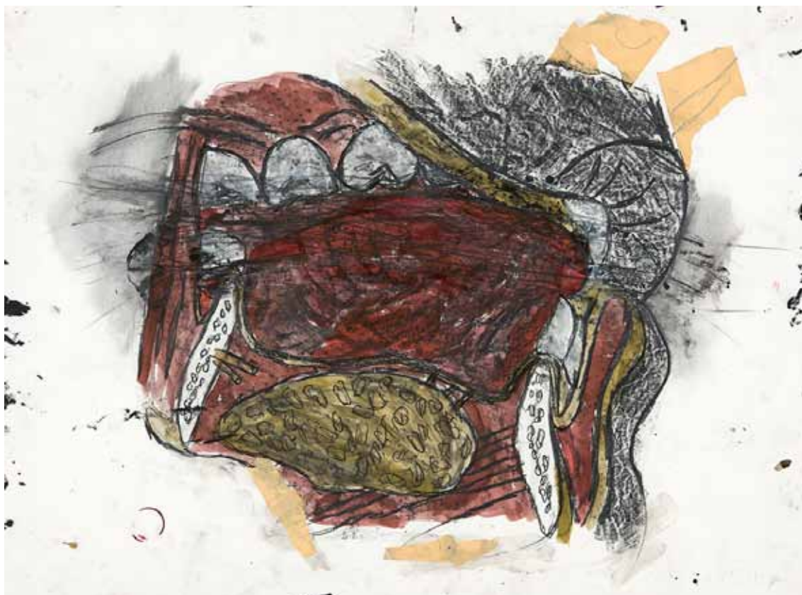
KIKI SMITH - Teeth drawing 4 , 1983 - Encre, graphite et acrylique sur papier - 56,8 x 76,5 cm - Galerie Lelong