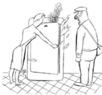
CHAVAL - Le réfrigérateur en flammes années 1950-1960 41 x 37,5 cm