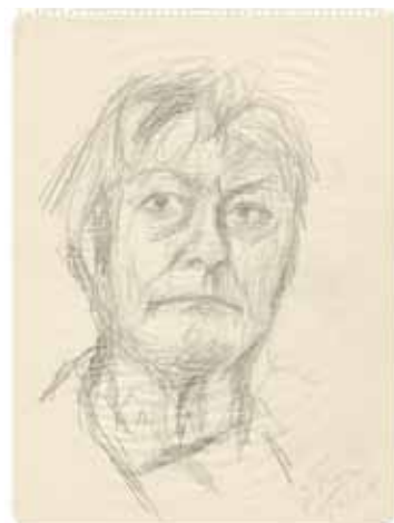
PIERRE TAL COAT - Autoportrait 1975-1976 - Mine de plomb sur papier - 31 x 23 cm Coll. particulière