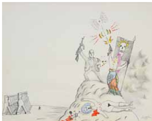
SAUL STEINBERG - Révolution culturelle – Art news 1970 - Crayon - 58 x 74 cm Coll. Isabelle Maeght, Paris © ADAGP, Paris 2015