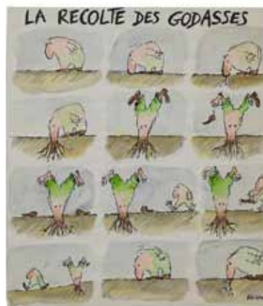
REISER - Dessin paru dans Hara-Kiri, années 1960-1970 - Encre et aquarelle 50 x 35 cm