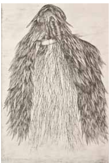
Fred DEUX , Les choses de moi , 1995, crayon et pastel, 77 x 57 cm. © Fred Deux, ADAGP Paris 2015 / Galerie Margaron / Photographie Whala Oh